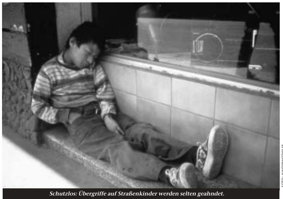
Schutzlos: Übergriffe auf Straßenkinder werden selten geahndet.

Weitere Informationen sind auf der Website http://www.casa-alianza.org erhältlich.