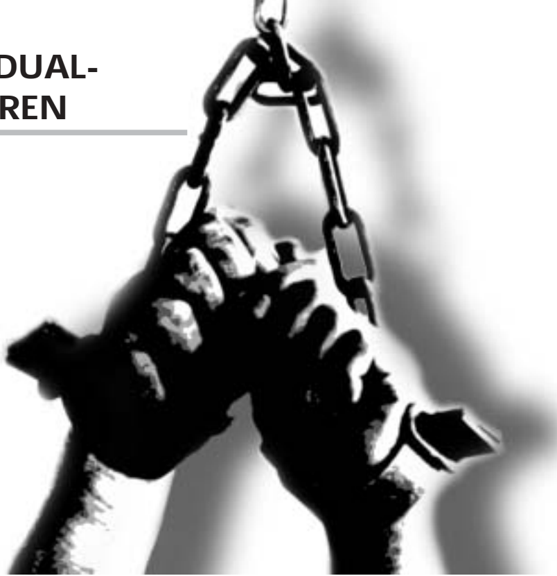
ILLUSTRATION NACH EINEM FOTO VON AMNESTY INTERNATIONAL

Der Menschenrechtsausschuss erklärte die Mitteilung am 25. Oktober 1994 für zulässig. Er stellte fest, dass Herr Pinto seine Vorwürfe nach Aussage