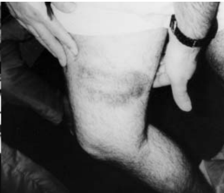
Polizisten prügeln beim Spalierlauf mit Knüppeln auf die Gefangenen ein.