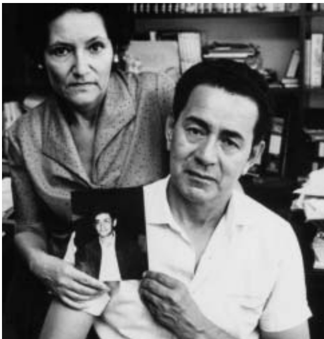
Peruanische Eltern mit einem Bild ihres „verschundenen“ Sohnes.