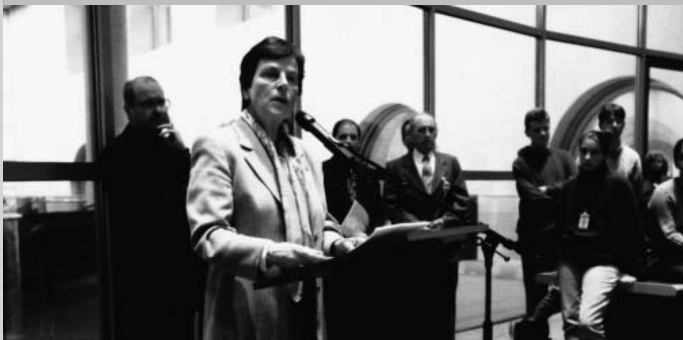
Anke Fuchs, ehemalige Vizepräsidentin des Deutschen Bundestag, befürwortet die Individualbeschwerde.