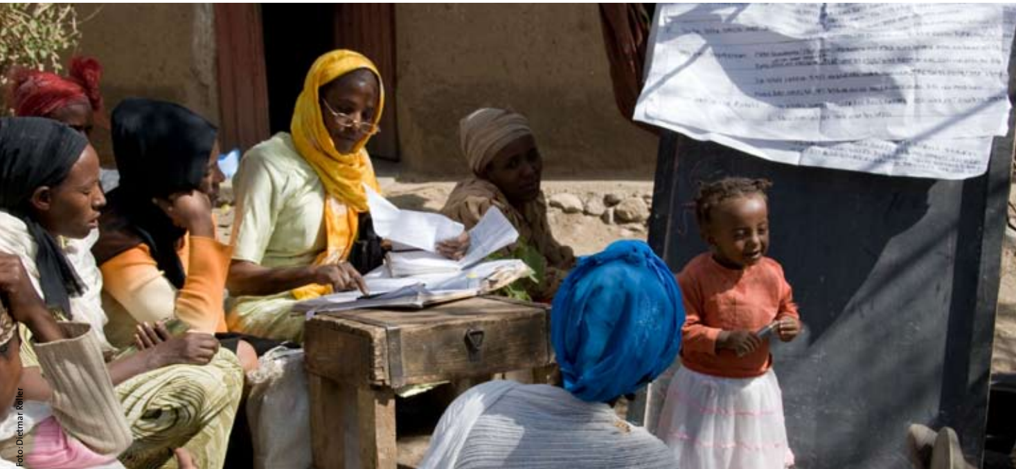
Eine Selbsthilfegruppe in Äthiopien: Kleinkredite werden zu günstigen Konditionen vergeben.