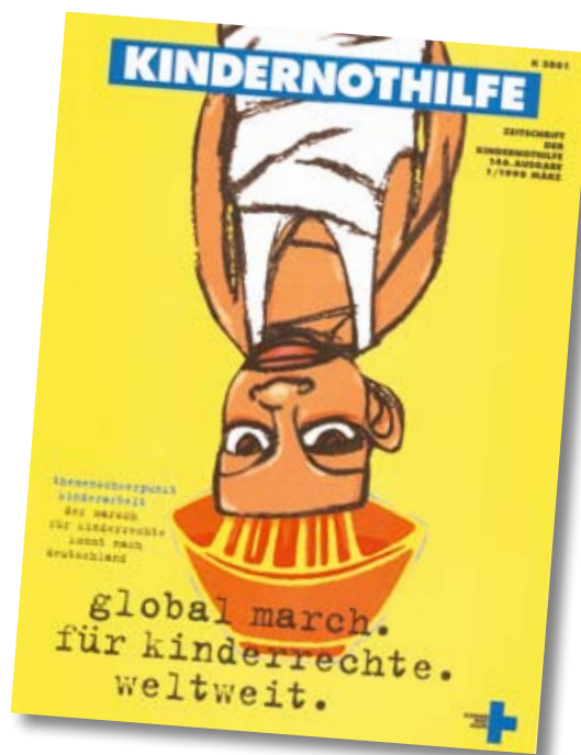
Gestaltung: Ulve Ernst, Illustration: Martin Baltscheit

Die Beschäftigung mit Kinderarbeit gehört zu den Kernthemen der Kindernothilfe. Weltweit werden die Entwicklungschancen