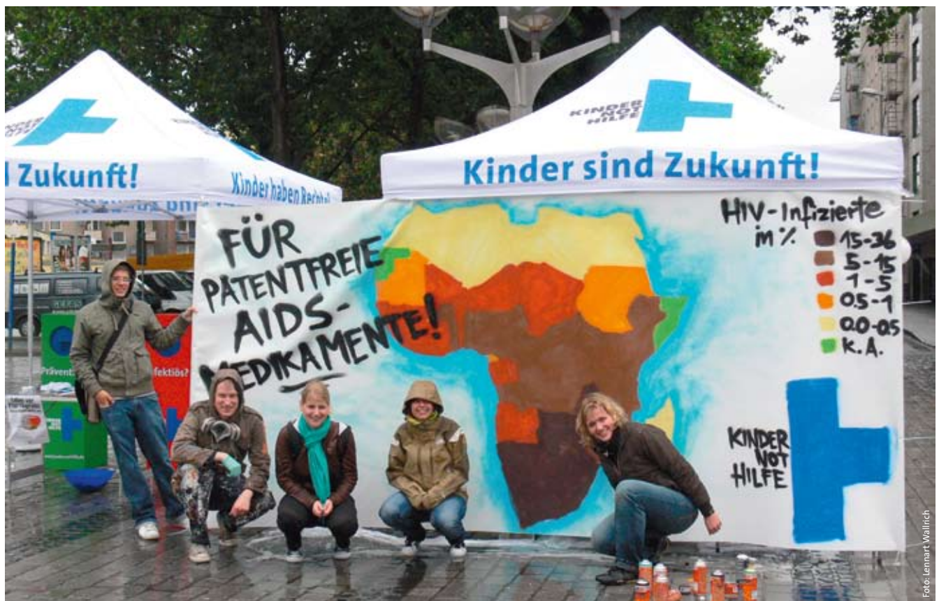
Live-Graffiti-Mitmach-Aktion in Duisburg zum Thema HIV/Aids im Juli 2008.

Die Kindernothilfe möchte eine Erweiterung der Altersstruktur bei den Ehrenamtlichen erreichen und mehr Jugendliche zur Mitarbeit motivieren. Dazu könnte die 2008 begonnene dreijährige Aids-Kampagne act positive dienen, die mit zwei europäischen Partnerorganisationen durchgeführt wird und sich explizit an Jugendliche richtet. Die Aktionsformen – internationale Jugendkonferenzen, eine Tournee der Theatergruppe des Kindernothilfepartners Youth for Christ aus Südafrika – sind ein guter Ansatz, um Jugendliche für ein ehrenamtliches Engagement zu gewinnen.