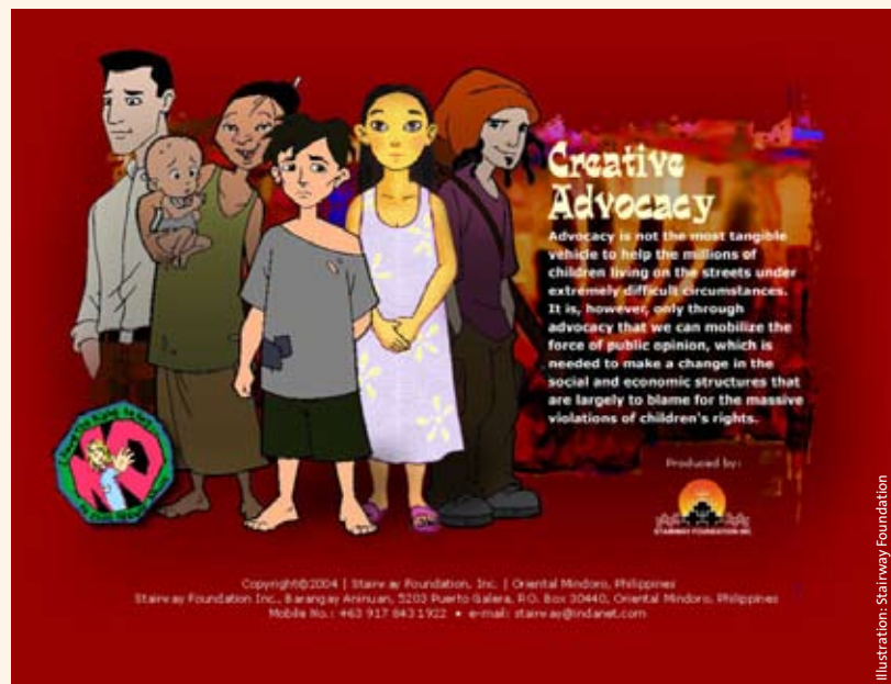
Poster zur Advocacy- Arbeit der Stairway Foundation

Eine andere Herausforderung ist, dass immer mehr Kinder den Mut haben, sexuellen Missbrauch anzuzeigen. Das ist natürlich eine positive Entwicklung, aber es müssen die Kompetenzen vorhanden sein, mit den Folgen auch professionell umzugehen. Advocacy-Arbeit kann also nicht losgelöst sein von konkreter Traumabearbeitung und sozialer Begleitung der Kinder.“