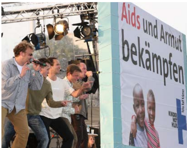
Die Wise Guys begeisterten beim Konzert auf dem Kirchentag 70.000 Menschen.

Eine wichtige Grundlage für die Lobbyarbeit sind die in der Fachöffentlichkeit weit beachteten Studien der Kindernothilfe 37 , in denen nachgewiesen wurde, dass in den PRSPs die Rechte von Kindern und Jugendlichen nahezu keine Rolle spielen, und dass Kinder und Jugendliche an der Gestaltung der PRSPs nicht beteiligt werden. Ziel der Lobbyarbeit ist es nun, dazu beizutragen, dass das bei der Bundesregierung gewachsene Bewusstsein über die Defizite der PRSPs sich auch in einen aktiven Einsatz für eine stärkere Berücksichtigung der kinderrechtlichen Perspektive umsetzt. Die Studien bilden auch die Grundlage