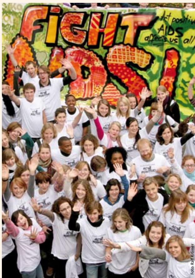
Teilnehmer der 1. Jugendkonferenz der Act-positive-Kampagne.