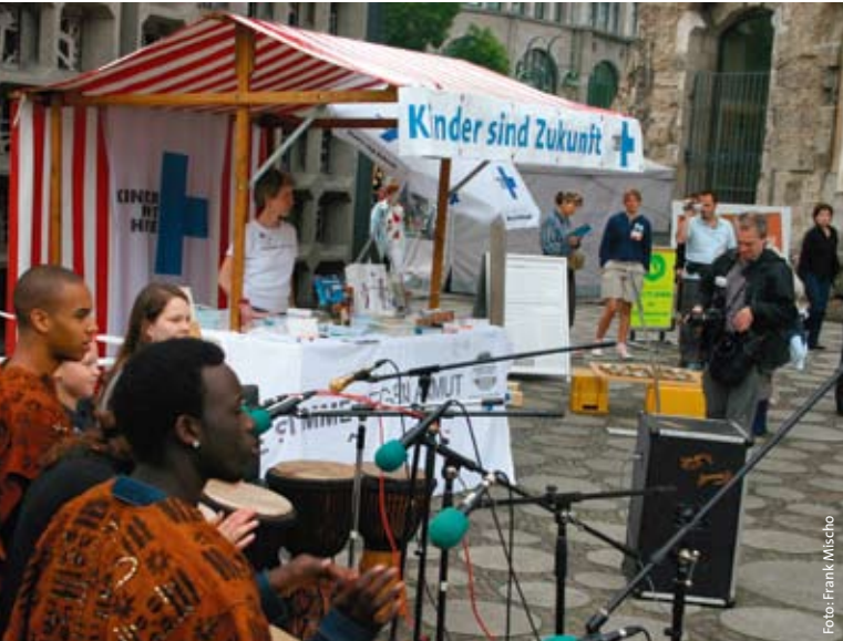
Kinderhilfe-Aktionsstand zu Armutsbekämpfung in Berlin im Juli 2005.

von Kinderarbeit geächtet sowie konkrete Maßnahmen zur Durchsetzung solcher Verbote und zur Rehabilitation der betroffenen Kinder festgeschrieben. Die Kinderhilfe war mit ihren überseeischen Partnern einer der Hauptträger dieser Kampagne und mit einem Beobachterstatus bei den ILO-Konferenzen 1998 und 1999 vertreten.