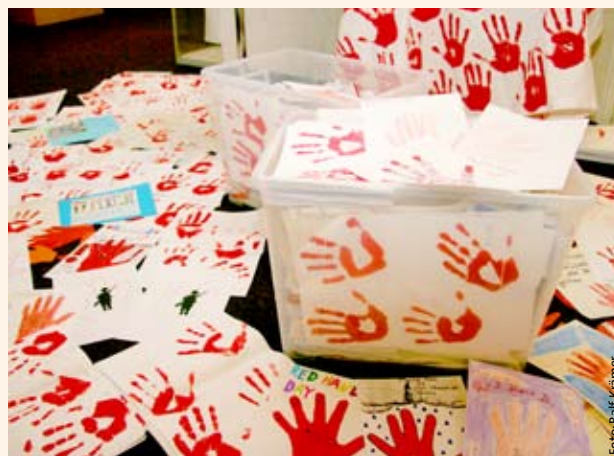
Arbeitskreise sammelten Handabdrücke zum Red-Hand-Day.

mobilisiert werden, so dass die Veranstaltungen kompetent mit lokalen Kräften durchgeführt werden können. Zu speziellen Themen werden auch Kindernothilfe-Mitarbeiter eingeladen.