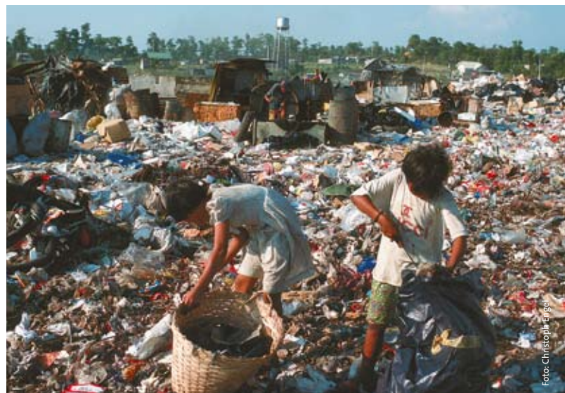
Arbeitende Kinder auf der Müllhalde in Payatas/Philippinen.

In der strategischen Planung für den Zeitraum von 1999 bis 2004 beschloss die Kindernothilfe, die Arbeit schrittweise auf mehr Breitenwirksamkeit auszurichten. Die Hälfte des Gesamtvolumens für die Projektunterstützung sollte bis 2004 in breitenwirksamere Projekte fließen. Breitenwirksamkeit sollte vor allem, aber nicht ausschließlich, über eine stärkere Gemeinwesenorientierung erreicht werden.