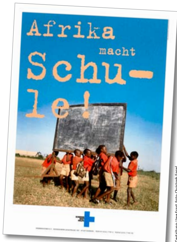
Gestaltung: Uwe Ernst

Programmatisch sah die Kindernothilfe die Stärkung des menschlichen Potentials als Beitrag zur Entwicklung und die Einzelfallhilfe als geeignetes Instrument dafür an. Mit dieser Position geriet die Kindernothilfe in den 1970er und 1980er Jahren ins Kreuzfeuer der Kritik. Etwa ab Mitte der 1970er Jahre hatte in Deutschland und international in Sachen Entwicklungshilfe ein Paradigmenwechsel begonnen, mit dem eine grundsätzliche Infragestellung der Formen und Instrumente der Entwicklungshilfe einherging. Vor allem die 1980er Jahre waren geprägt von Ernüchterung über die unzureichenden Erfolge der ersten Entwicklungsdekaden. In der ökumenischen Bewegung und in den internationalen Organisationen im Umfeld der Vereinten Nationen folgten Grundsatzdebatten über die richtigen Entwicklungsstrategien. Der Zeitgeist war radikal, und gegenüber der Entwicklungshilfe wurde pauschal der Vorwurf erhoben, sie