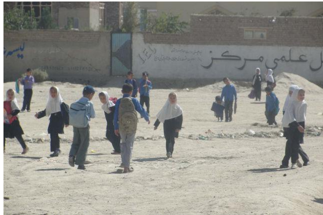
Gemeinsames Spielen stärkt den Gemeinschaftssinn der Kinder.

Neben Lehrern werden auch Eltern, Älteste, Stammesführer und Mitarbeiter von Behörden zu den Themen Kinderrechte und Kinderschutz geschult. Sie lernen, sich gegen Kinderhandel und Kindesmissbrauch einzusetzen. Verschiedene Poster und Informationsbroschüren zum Thema Kinderschutz werden verteilt. Auch hat HAWCA eine Kinderschutz-Policy entwickelt, die in der Gemeinschaft verankert werden soll. Ziel ist es, Fälle von Missbrauch und Misshandlung zu erkennen, den Kindern zu helfen und die Täter zu bestrafen. Schriften von Frauenrechtsaktivisten werden in die landeseigene Sprache Dari übersetzt, damit die Menschen die Botschaften auch verstehen können.