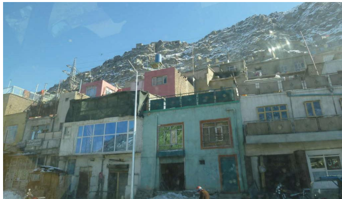
Bewaffnete Konflikte haben Afghanistan stark geprägt.

Noch immer prägen Terror und Gewalt das Leben in Afghanistan. Neben der instabilen Sicherheitslage hat die afghanische Gesellschaft vor allem mit Armut und einem unzureichenden Bildungssystem zu kämpfen. So haben die Taliban viele Schulen niedergebrannt und Schulbücher sind Mangelware. Die Konflikte in dem Land ließen viele Jungen und Mädchen traumatisiert zurück. Anstatt die Schule besuchen zu können, müssen viele von ihnen arbeiten und sind von Menschenhandel bedroht. Doch Bildung ist der Schlüssel für die Chance auf eine bessere Zukunft ohne Armut und Gewalt.