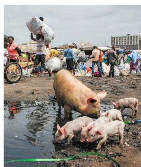
Der Dantokpa-Markt in Cotonou ist ein Zentrum des Menschenhandels

schwätzen den überforderten Eltern ihre Kinder ab. Die Frauen geben oft vor, reiche Philanthropinnen aus der Hauptstadt zu sein, und versprechen gute Arbeit und Geld für das Kind. Die Eltern sehen ihr Kind nie wieder, und Geld wird auch keines gesendet werden.