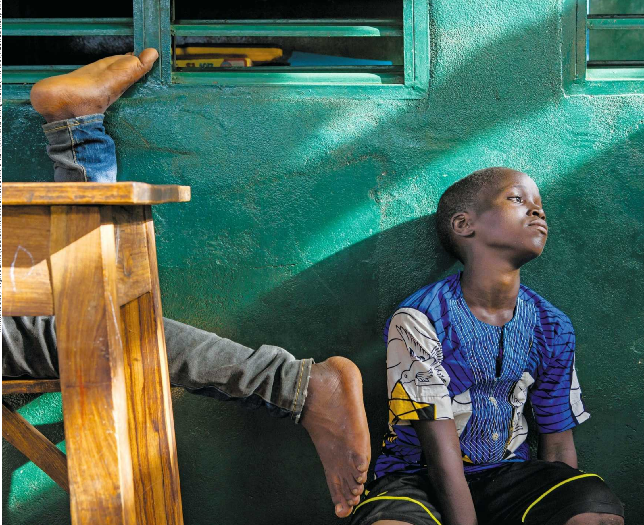
Straßenkinder in einer Unterkunft des Salesianerordens in der Hauptstadt Porto Novo